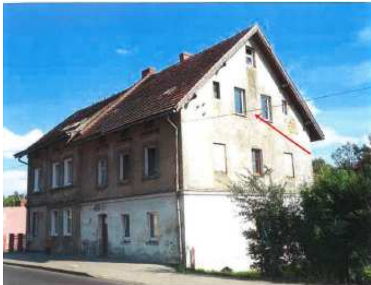
Widok elewacji frontowej- ul. Łużycka nr 46a.

na sprzedaż lokalu mieszkalnego Nr 3, znajdującego się w budynku położonym w Lubaniu przy ul. Łużyckiej 46a wraz z udziałem we współwłasności nieruchomości gruntowej (działka nr 48, AM 18, Obręb II o powierzchni 82 m 2 , JG1L/00016386/4)